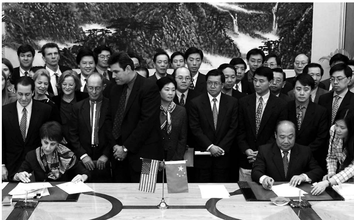
1999年11月15日，中美两国就中国加入世贸组织达成协议

先，谈判的各方（双、多边）必须平等，任何一方不能强行让对方接受不可能接受的内容，我们始终坚持这一原则。在平等的基础上，我们始终坚定地维护国家核心利益，不能同意的坚决不同意，应该得到的，必须得到，否则宁可不加入世贸组织。比如，通过加入世贸组织必须解决美国长期拒绝给中国无条件最惠国待遇的问题，必须坚持中国的发展中国家地位，必须坚持加入世贸组织确保中国国家政治经济安全，如：电讯的关口局，外国只能通过中国关口局，确保国家安全；经济上，不放开A股市场，人寿保险合资外方股比不能超过50%，等等。